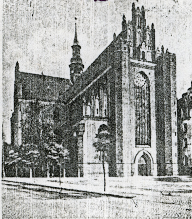
Gotyck: PELPLIN (woj. pomorskie). Fasada Katedry.